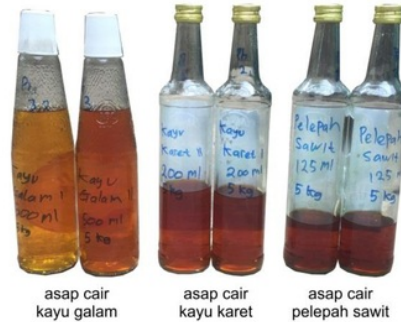
Gambar 2. Penampilan fisik tiga jenis asap cair yang dihasilkan.